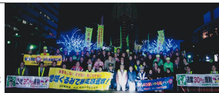
H25年11月21日暴走族追放総決起大会では150名以上が集合しました

その活動は暴走族の出現の抑制のみならず、警察や行政も動かし、監視カメラの設置、ゾーン30制定などにもつながり、実際通報数が減少しています。とはいえ、まだゼロではありません。地域住民でゼロを目指して、パトロールしましょう! 毎月第4金曜日21時に公民館において下さい。(警察官も同行します)